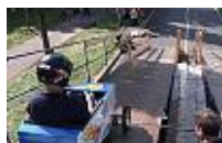
Das Seifenkisten-Rennen in Leverkusen Edelrath