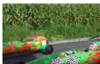
Impressionen vom 6. Seifenkistenrennen in Edelrath