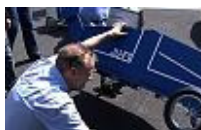
Seifenkisten-Check vor dem Rennen