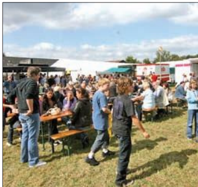
Buntes Treiben, Kirmes und natürlich der Smidt-Seifenkisten-Cup locken am Wochenende nach Edelrath.

Tel. (0214) 855 65 0 Fax (0214) 855 65 9 Steingass@steingass.org