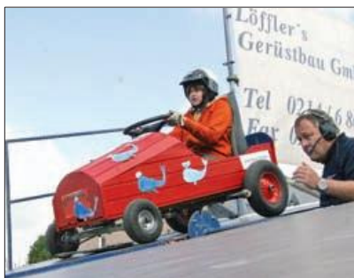
Am Samstag flitzen sie wieder den Berg hinunter: Zum Smidt-Seifenkisten-Cup sind rund 50 Teilnehmer gemeldet.

»Funky Marys« wird den Gästen mit ihrem Live-Auftritt kräftig einheizen. Durch den Abend wird die Band »Himmel & Ad« führen, die mittlerweile genau weiß wie sie in Edelrath das Festzelt zum feiern bringt. An so einem Abend darf natürlich auch die Tradition des »Pohlhauen« nicht fehlen. Der Samstag hat seit sechs Jahren nun eine bekannte große Überschrift: Smidt-Seifenkistencup. In diesem Jahr werden über 50 Teilnehmer mit ihren selbstgebauten Seifenkisten um den Sieg kämpfen. Ein abwechslungsreiches Programm sorgt für beste Unterhaltung auf und um die Rennstrecke herum. Sogar der TV-Sender Center TV begleitet dieses Rennen und nimmt auch selbst teil. Am Abend (20 Uhr) heißt es »Af-